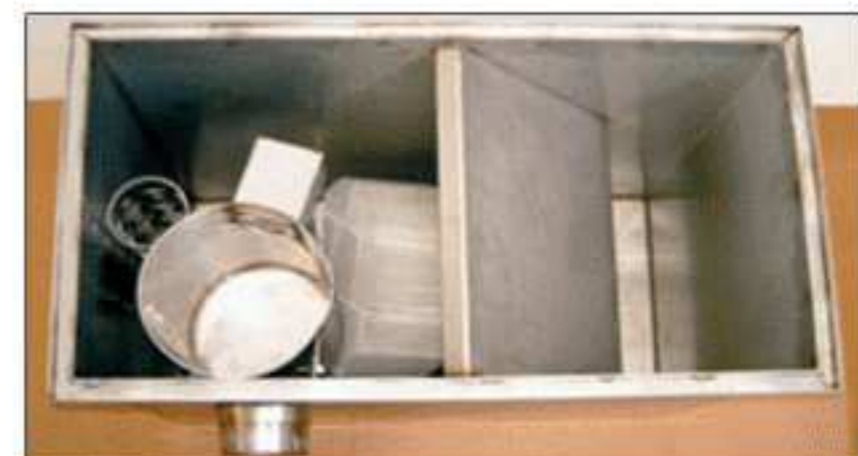
TABLA EQUIPOS INOX Y ACERO PINTADO